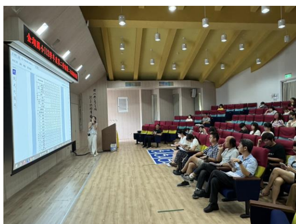
委員確認課程架構表